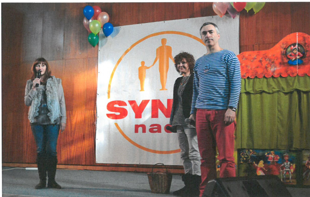
Magdina Kouzelná školka bavila pěstounské děti