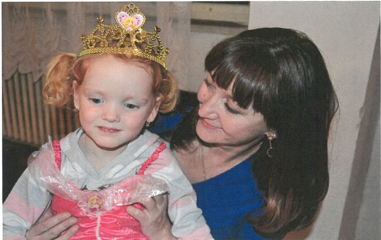
Vánoce strávila nadace s dětmi ve Frýdlantě – DD Frýdlant