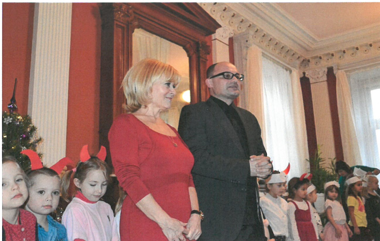
Staroušky potěšila nadace i děti – DD Český Dub