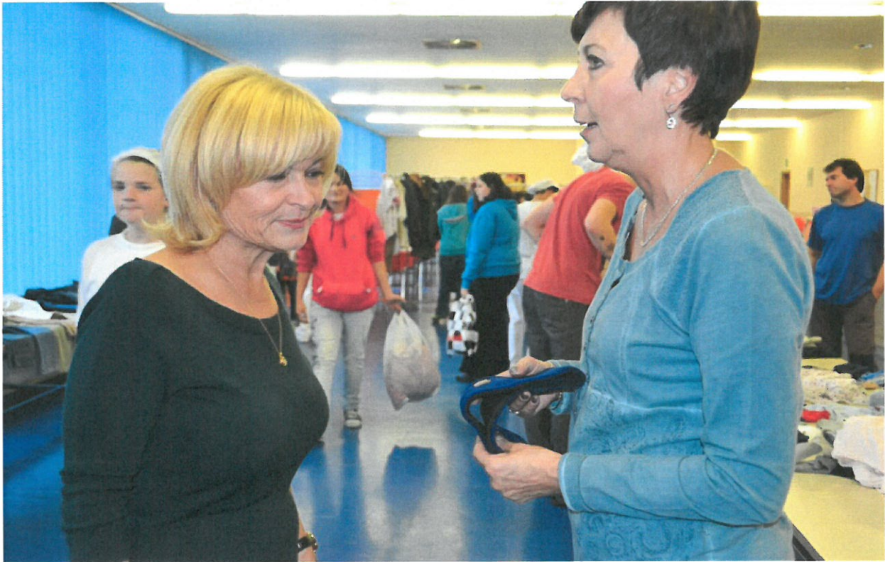
Setkání nadace na SOŠ Jablonecká