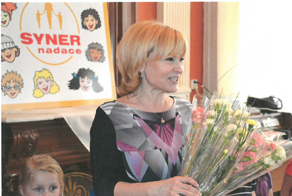
Nadační přání maminkám, babičkám, prostě všem ženám – DD Český Dub