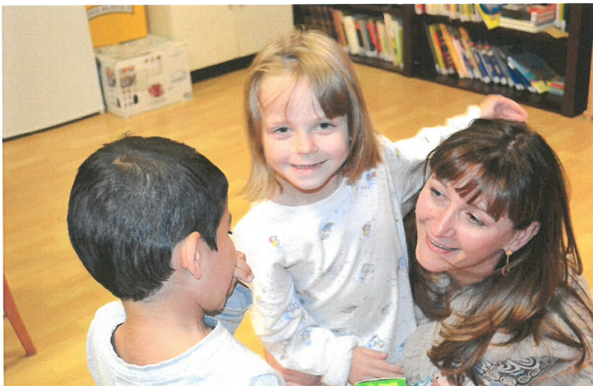
Nadace zavítala do domova - DD Dubá Deštná