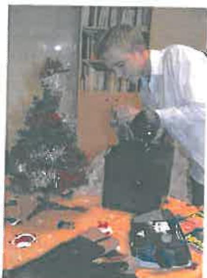
První Ježíšek přišel s Nadací SYNER do DD Česká Lípa